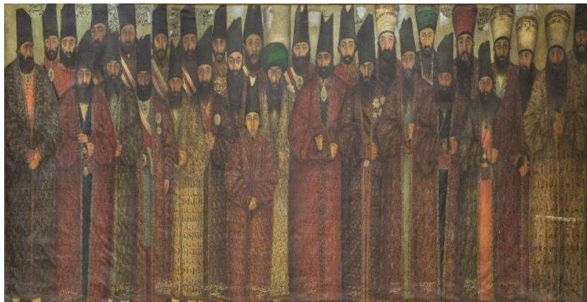
تصویر ۹: پرده سلام نوروزی ناصرالدین‌شاه، رنگ و روغن روی بوم، ۱۸۵۳/۱۲۷۰ تا ۱۸۵۷/۱۲۷۴، از عمارت نظامیه، محفوظ در کاخ موزه گلستان (تهران). (نگارنده)