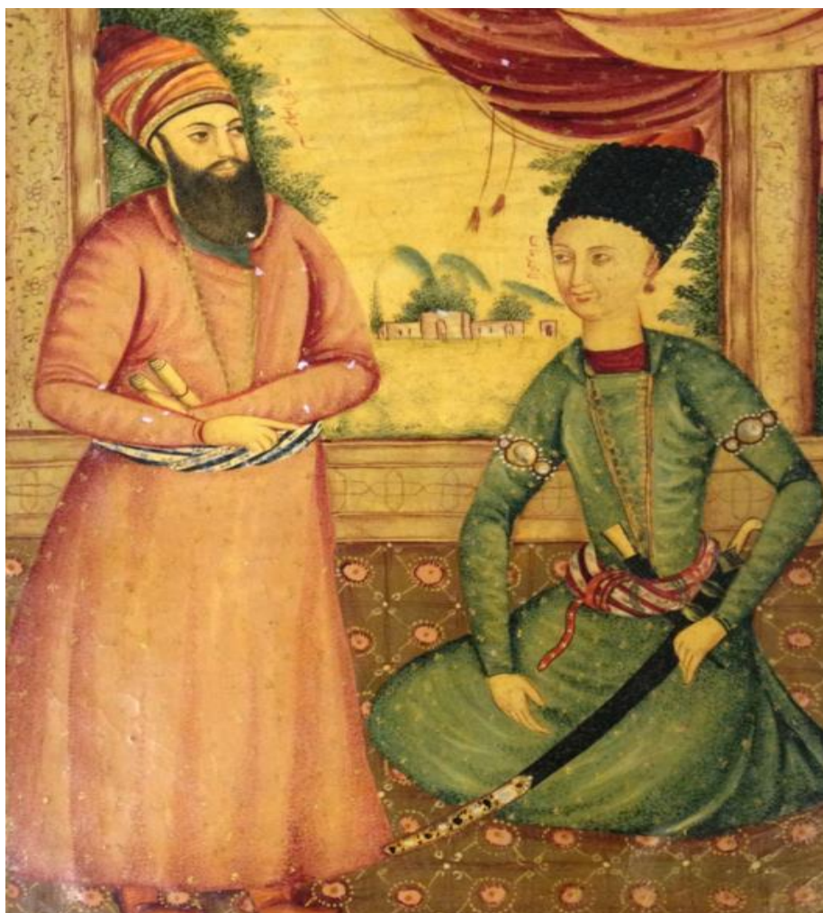
تصویر ۷: تصویر آقا محمد خان قاجار با تاج و میرزا ابراهیم کلاتر که به واسطه خیانت به لطفعلی خان زند (حک):

گوسفند با لبه خاصی که با ظرافت در جای خود حرکت می‌کرد و آفتابگردان نامیده می‌شد. مفهوم این واژه این بود که لبه کلاه با آفتاب حرکت می‌کرد و برای جلوگیری از تابش آفتاب به سو لازم بود چرخانده می‌شد (مک‌گرگور، ۱۳۶۸، ۱۹/۲)، حاج طرخان (نوعی کلاه پوستی خاص اعیان و اشراف با نشان آهنین شیر و خورشید) (غیبی، ۱۳۹۶: ۵۳۳)، پوستی، فینه و عرقچین رواج پیدا کرد. (عظیم‌زاده و سعادت‌فر، ۱۳۹۵: ۳۲۳)