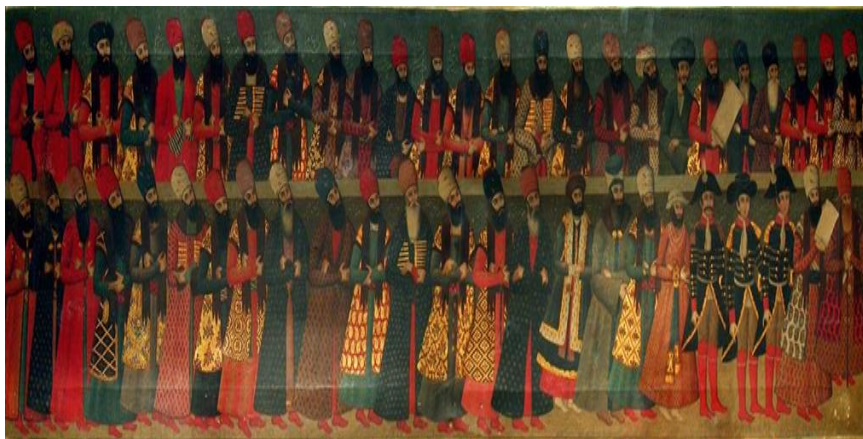
تصویر ۸: بخشی از پرده سلام نوروزی فتحعلی‌شاه، رنگ‌روغن و طلا روی بوم، مجموعه رابرت فاینن (لندن)، ۱۸۱۵/۱۲۳۰

استفاده از عمامه و شال کلاه در دوران فتحعلی شاه قاجار (حک: ۱۲۱۲-۱۲۵۰ ق/۱۱۷۶-۱۲۱۳ ش)، (تصویر ۸) و نیز استفاده از کلاه به جای عمامه و شال کلاه در دوره ناصرالدین شاه حکایت می‌کند. (تصویر ۹)