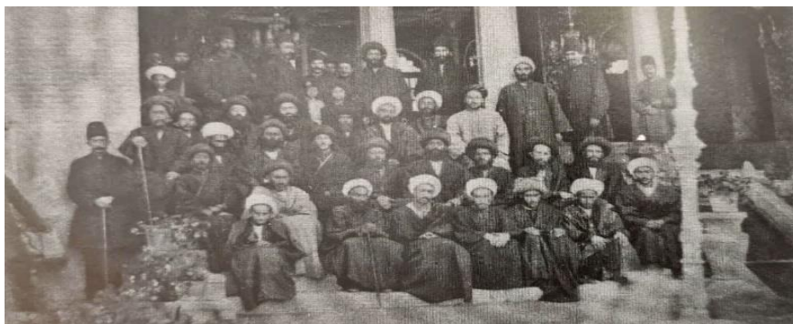
با این حال، عمامه به سر دارند (شهبهانی، ۱۳۹۶: ۸۲)

قاجار آمده است: «گویی همه عمامه به سر به دنیا می‌آمدند» (جمالزاده، ۱۳۸۰: ۹۳) این ویژگی در دیگر نقاط ایران نیز مشهود بوده است. بر این اساس؛ اقشار مختلف جامعه از عمامه به عنوان سرپوش بهره می‌بردند. آن گونه که عمامه سرپوش رسمی علما و روحانیون بود.