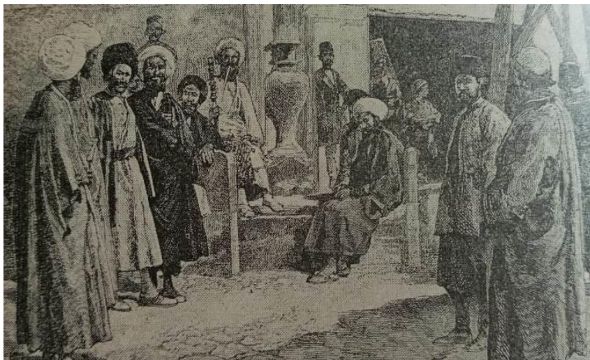
تصویر ۶: جمعی از سیدان و روحانیون مذهبی (دیولافوا، ۱۳۳۲: ۲۹۳)

راهنمای ما فرستاده است که با وقار مخصوصی روی سکوه‌های سنگ مرمر جلوی خان نشسته و انتظار ورود ما را دارند، بعضی عمامه پرحجمی از ململ سفید دارند که بر وقار آن‌ها می‌افزاید؛ پاره‌ای هم عمامه‌های بزرگ آبی‌رنگ بر سر دارند که علامت مخصوص اعقاب پیامبر (ص) است (تصویر ۶)». (دیولافوا، ۱۳۳۲: ۲۹۲)