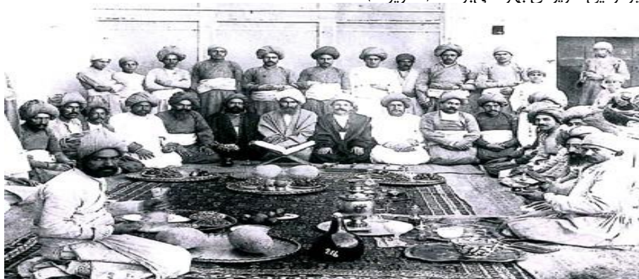
تصویر ۳: مجلس جشن و اوستا خوانی زرتشتیان در یزد، دهه ۱۳۱۰ ق. (سوروگین، ۱۳۷۸: ۱۰۶)

تصویر ۲: جمعی از علما و روحانیون با عمامه‌های سیاه و سفید (آتابای، ۱۳۵۷، آلبوم ۲۸: ۲۱۹) در میان فرقه‌های مختلف نیز سرپوش عمامه رایج بود. یکی از سیاحان در توضیح لباس شیخی قادری مذهب عمامه را به عنوان سرپوش او یاد می‌کند که آن را به دور فینه‌ای پیچیده و بر سر گذارده بود. (اوبن، ۱۳۶۲: ۴۱۸-۴۱۹) آن چنانکه بر سر گرفتن عمامه در میان پیروان دیگر ادیان نیز مرسوم بوده است. به عنوان نمونه، زرتشتی‌ها عمامه کوچک زردی بر سر می‌گذارند (براون، ۱۳۷۱: ۱۵۸). برخی دیگر از سیاحان دستارهای آن‌ها را به رنگ قهوه‌ای گزارش کرده‌اند که ممکن است به دلیل تفاوت در سکونت‌گاه بوده باشد. (شهبهانی، ۱۳۹۶: ۷۹) همچنانکه برخی از یهودیان نیز از این سرپوش بهره می‌بردند. (تصویر ۴)